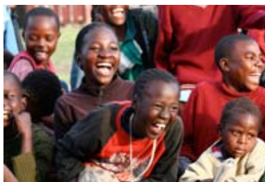
Magia en Kenia