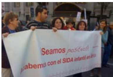
Manifestación Lucha contra la Pobreza