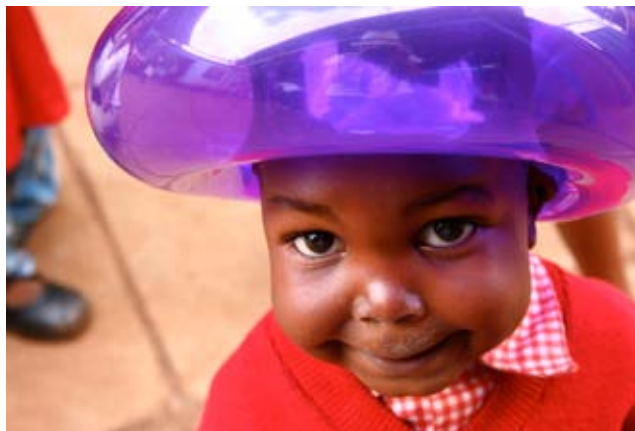
Niño en Lea Toto de Kibera