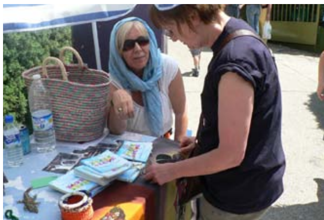
En mayo 2010 se celebró la tradicional fiesta de mayo en el King’s College de Soto de Viñuelas. Allí estábamos presentes con las artesanías de Kibera y las cestas del Village.

El colegio King’s College ha seguido apoyándonos en todos sus centros. (King’s College Soto de Viñuelas, King’s College School, La Moraleja y King’s Infant School en Chamartín). El total de aportaciones en conjunto durante 2010 ha sido de 13.529,48 €