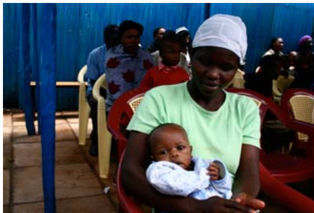
Mamá con su bebé en Lea Toto

La experiencia adquirida durante estos dos meses a través de los casos específicos identificados por el personal del programa, nos ha dejado ver la necesidad de articular un procedimiento interno que permita a los trabajadores/as detectar correctamente dichas violaciones y derivar los casos de acuerdo con las necesidades concretas de cada uno de ellos. Así, por ejemplo, existen determinados casos en los que no es recomendable acudir directamente a la vía judicial sin probar previamente la vía de