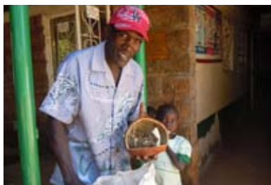
Campaña de Belenes