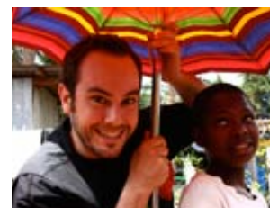
Magos de la Fundación Abracadabra durante su actuación

Los voluntarios son personas que colaboran de manera permanente o puntual sin realizar aportaciones económicas. En el marco del acuerdo de colaboración con la Universidad Pontificia de Comillas ha habido cinco voluntarios.