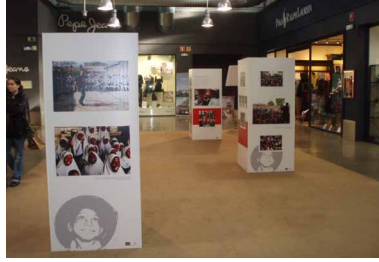
"Magia en Kenia" en el outlet Factory de Sevilla