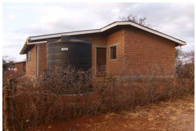
Casa financiada por Amigos de Nyumbani