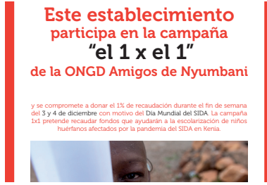
Campaña: "el 1 x el 1"