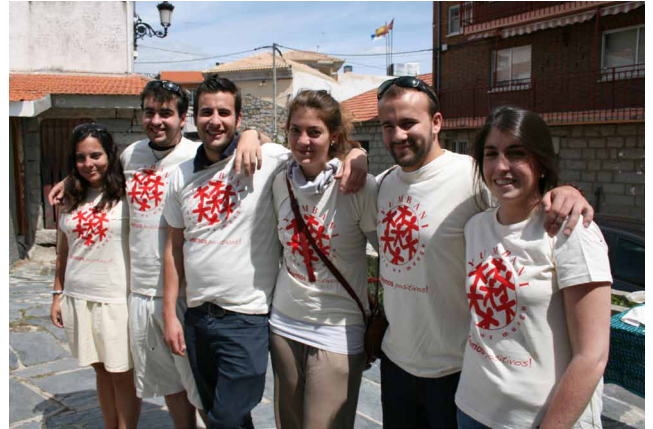
Nuestros voluntarios 2011

A todos ellos queremos hacerles patente nuestro agradecimiento por su labor, su dedicación y su altruismo. El programa de voluntariado en Amigos de Nyumbani es algo fundamental que sirve no solo para realizar una labor muy encomiable y necesaria sobre el terreno, si no también para reforzar en España nuestra base social.