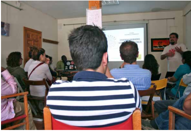
Jornadas "Sida, África y Desarrollo"