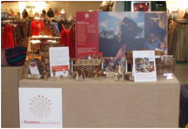
Venta de artesanías en el Factory de Sevilla