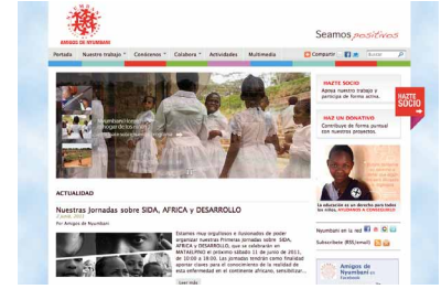
Web de Amigos de Nyumbani