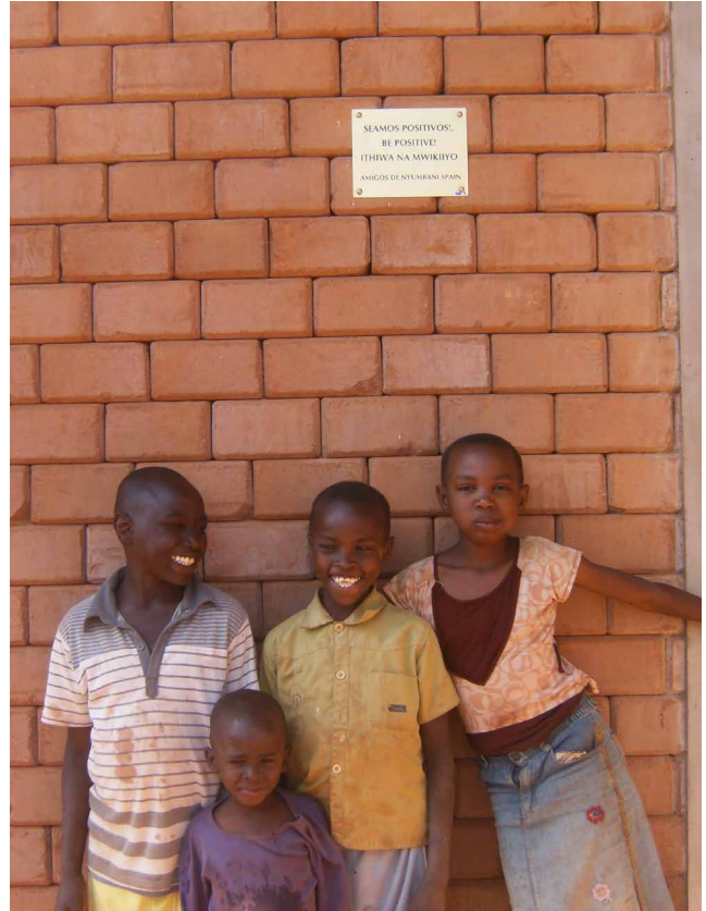
Familia que vive en la casa