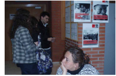
Universidad Carlos III, Semana de la Solidaridad