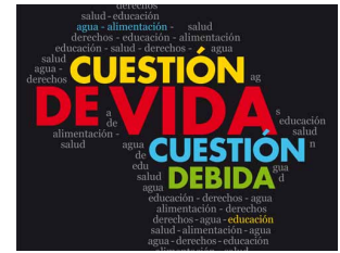
Campana: "África, cuestión de vida, cuestión debida"

Se han recibido también un número importante de donaciones puntuales destacando, las recibidas por la Fundación Mary Ward, la cofradía del Mago Luigi que realizó una gala solidaria y la de la empresa Inmobiliaria del Sur. A todos ellos se les ha hecho llegar nuestro reconocimiento y agradecimiento. Gracias también a las familias del King's College que nos apoyan desde hace años.